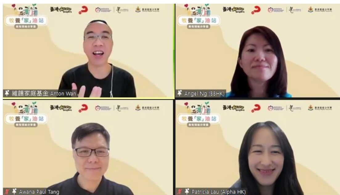
圖六：四位機構負責人、總幹事坐在一起交流討論。

四間機構選擇在國際家庭日前一天舉行這個聚會，因為在第五波疫情期間，見到牧者表達在持續兩年的疫情下，牧養家庭和孩子的的工作愈來愈不容易，故此希望藉此聚會拋磚引玉，與一眾堂會領袖共商對策，在截止日期前共收到有超過 130 位來自不同堂會的牧者報名參加，當中亦有來自加拿大、馬來西亞等外地的牧者參加。